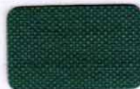
フォレストグリーン